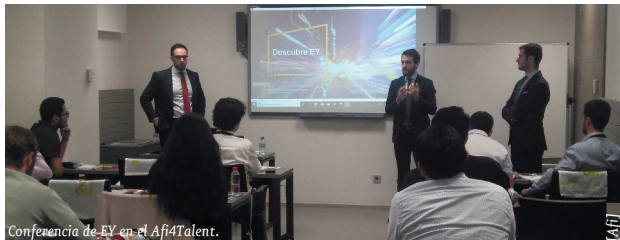
Conferencia de EY en el Afi4Talent.

Este 22 de octubre celebramos la tercera edición de Afi4Talent , un evento de Afi Escuela de Finanzas para acercar al alumnado recién graduado de nuestros másteres (particularmente Máster en Finanzas Cuantitativas, Master in Banking & Finance y Máster en Data Science y Big Data ) a las grandes empresas del sector.