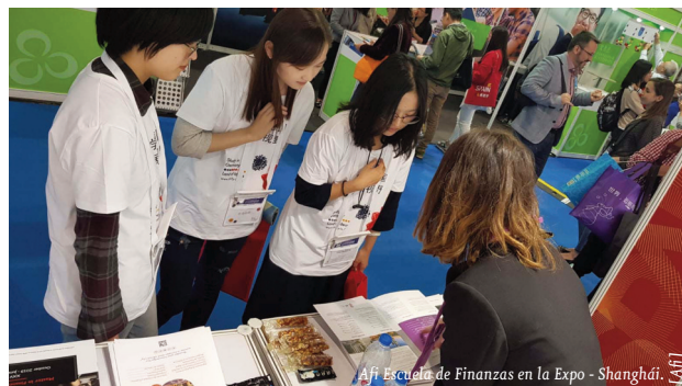
Afi Escuela de Finanzas en la Expo - Shanghái.

Entre los días 27 y 28 de octubre, Afi Escuela de Finanzas viajó hasta Shanghái para presentar los programas educativos en la China Education Expo , el principal evento educativo en China donde tuvieron presencia 551 centros de 37 países, y que es organizado por la China Education Association for International Exchange desde hace 18 años.