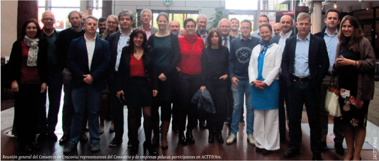
Reunión general del Consorcio en Cracovia: representantes del Consorcio y de empresas polacas participantes en ACTTiVate.

Con motivo de la reunión entre todos los miembros del Consorcio, fueron invitadas dos empresas polacas que están participando en ACTTiVate. Ello nos ha permitido conocer de primera mano no solo los proyectos de innovación en desarrollo, sino también la percepción de las empresas sobre el apoyo brindado y el valor que les aporta la iniciativa.