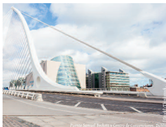
Puente Samuel Beckett y Centro de Convenciones, Dublín.

Con tasas de crecimiento de dos dígitos, Irlanda vuelve a recuperar su apelativo de tigre celta acuñado en los noventa del siglo pasado, superando así la crisis del estallido de la burbuja inmobiliaria de 2008 y el rescate europeo de valorado en 85.000 millones de euros. No obstante, las cifras oficiales del PIB de Irlanda se han convertido en una variable cada vez menos fiable, debido a la distorsión que supone la alta presencia de multinacionales extranjeras. Prueba de ello ha sido la revisión al alza del crecimiento del PIB real en 2015, que pasó del 7,8% al 26,3%. Esta pronunciada subida se explica por el registro en las cuentas nacionales de las inversiones/operaciones de las multinacionales instaladas en el país. Dado que el crecimiento económico de 2015 fue excepcional y, considerando el impacto del Brexit —especialmente sensible para la economía irlandesa—, se espera una desaceleración en los próximos años. Así, The Economist Intelligence Unit (EIU en adelante) estima un crecimiento del 3,7% en 2016 y aún menor en los próximos años (3,2% de promedio para el periodo 2017-2021).