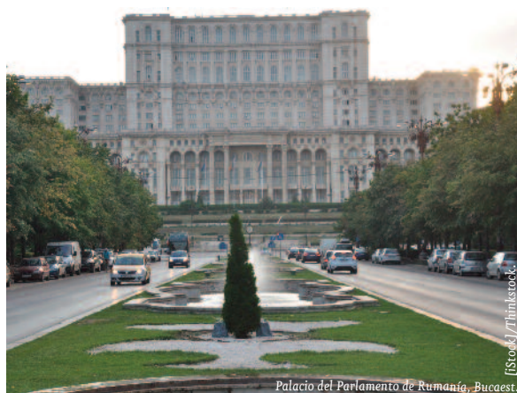
Palacio del Parlamento de Rumanía, Bucarest.

Rumanía se sitúa a la vanguardia del crecimiento en la UE. Se espera que el crecimiento real del PIB se acelere hasta el 5% en 2016, 1,2 puntos más que en 2015. El au-