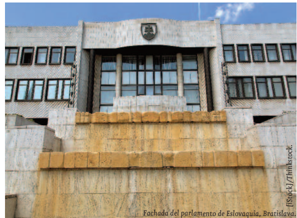
Fachada del parlamento de Eslovaquia, Bratislava

Aunque las dificultades políticas han aumentado, Eslovaquia goza de una sólida estabilidad que repercute en unos indicadores macroeconómicos favorables. El reto del futuro es avanzar en la diversificación y especialización en producciones de