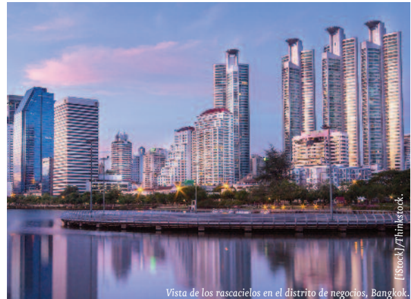
Vista de los rascacielos en el distrito de negocios, Bangkok.

Las perspectivas de estabilidad política y reconciliación del país han mejorado sensiblemente tras la aprobación en referéndum de la nueva Carta en agosto de 2016 y con el anuncio de unas futuras elecciones democráticas para finales de 2017. Como contrapartida, la nueva Constitución legitima el intervencionismo del ejército en los gobiernos futuros.