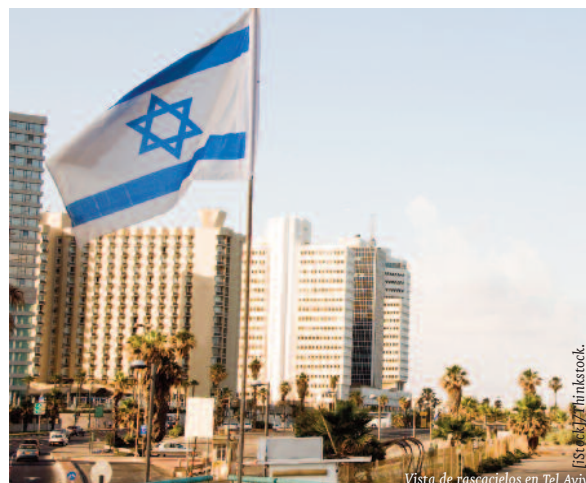
Vista de rascacielos en Tel Aviv.

Las relaciones internacionales están condicionadas por la causa palestina y un convulso marco geopolítico en el Próximo Oriente. El reciente aumento de la violencia entre israelíes y palestinos ha disminuido aún más las esperanzas de una reactivación de las negociaciones. La política de asentamientos en Cisjordania, la reconsideración del estatus de la minoría árabe del país y la falta de reconocimiento de un Estado pa-