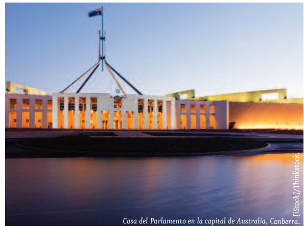
Casa del Parlamento en la capital de Australia, Canberra.

Las estrechas relaciones comerciales con los países asiáticos y su población culturalmente diversa convierten a Australia en un mercado ideal para la internacionalización de las empresas españolas. Ha suscrito acuerdos bilaterales de libre co-