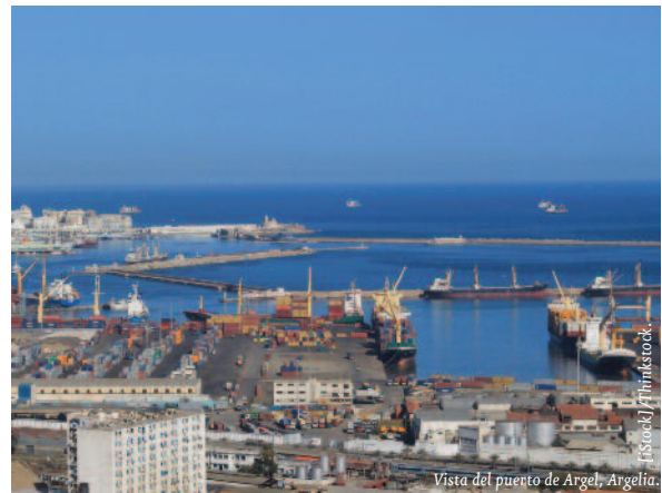
Vista del puerto de Argel, Argelia.

Los graves problemas sociales que motivaron la Primavera Árabe, tales como el alto desempleo juvenil, la limitada expresión política y la elevada percepción de la