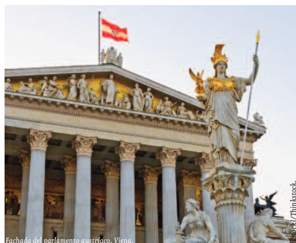
Fachada del parlamento austríaco, Viena.

La coalición en el Gobierno, que había renovado su mandato a finales de 2013 y que está integrada por el Partido de los Austriacos, de centro – derecha, y el Partido Social Democrático, de centro izquierda, tiene además que responder a dificultades internas para conseguir avances en materia de reformas estructurales, así como para combatir el creciente paro y lidiar con un contexto de crecimiento económico interno languidecido. A ello hay