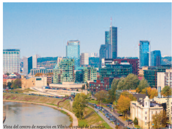
Vista del centro de negocios en Vilnius, capital de Lituania.

En lo referente al sector exterior, la balanza por cuenta corriente experimentará un saldo negativo del 2,6% del PIB para este año y del 3,7% para el 2016. Pese a ello, las exportaciones lituanas no han perdido competitividad gracias a que su base exportadora está muy diversificada entre partidas