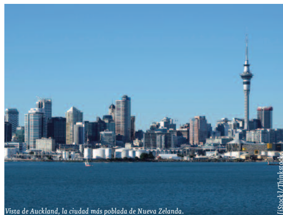
Vista de Auckland, la ciudad más poblada de Nueva Zelanda.

Con todo ello, Nueva Zelanda se sitúa en el segundo puesto (entre un total de 189 economías) en cuanto a la facilidad para hacer negocios según el