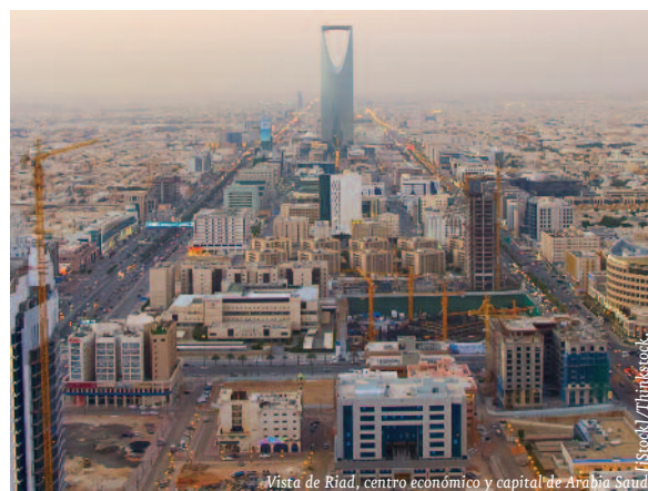
Vista de Riad, centro económico y capital de Arabia Saudí.

En el plano internacional, Arabia Saudí, bajo el Gobierno precedente, había adoptado una política exterior muy activa, ejemplificada por su participación en los ataques aéreos contra el Estado Islámico en Siria. Sin embargo, el rey Salman