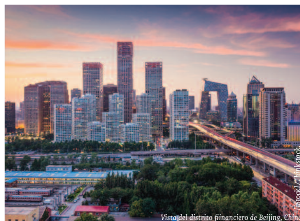
Vista del distrito financiero de Beijing, China.

China se configura bajo la forma de Estado comunista, con un sistema unipartidista al frente: el Partido Comunista Chino (PCC). La ideología fundamental del régimen está integrada por el marxismo-leninismo y las aportaciones realizadas por Mao Zedong y otros líderes del partido como Deng Xiaoping o Hu Jintao. Las cuatro estructuras principales de poder son el PCC, el Estado, la Asamblea Nacional Popular y el Ejército de Liberación Popular. En marzo de 2013 se produjo una renovación de diversos cargos políticos, incluyendo el del presidente, momento en el que Xi Jinping relevó a Hu Jintao, quien llevaba 60 años en el poder. Asimismo, el primer ministro Wen Jiabao fue relevado por Li Keqiang. De esta forma se completaba la transferencia de poder a una generación más joven. Los nuevos dirigentes lanzaron una campaña contra la corrupción, aunque su impacto tiene todavía amplio recorrido. Por lo demás, el Gobierno chino ha mantenido una firme línea ideológica, resistiéndose a las tendencias occidentales y ejerciendo un control sobre los medios e internet. Por su parte, desde Economist Business Unit (EIU) se considera que las reformas judiciales anunciadas en el pleno, que incluyen planes para dotar de mayor independencia a las cortes frente a los organismos locales, constituirán la principal reforma política