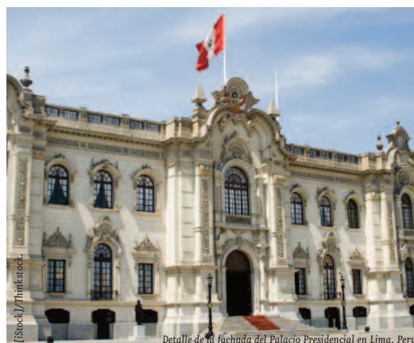
Detalle de la fachada del Palacio Presidencial en Lima, Perú.

En materia de política exterior, el Gobierno de Humala se encuentra centrado en fortalecer la integración regional, apoyando, entre otras iniciativas, la recién creada Alianza del Pacífico, un pacto de integración para fomentar la libre circulación de bienes, servicios, capitales y personas entre Chile, Colombia, México y Perú. Además, esta iniciativa también promueve un mayor crecimiento, desarrollo y competitividad de las econo-