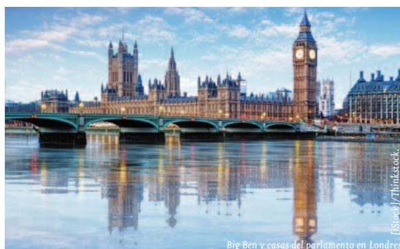
Big Ben y casas del parlamento en Londres.

En septiembre de 2014, Escocia votó no en el referéndum sobre su independencia, lo que ha permitido asegurar la continuidad económica y fiscal del Reino Unido, aunque Cameron ha prometido la concesión de ciertos poderes al parlamento escocés. En este sentido, en noviembre de 2014 la comisión parlamentaria británica cedió a Escocia la recaudación directa de los impuestos sobre la renta, y propuso ceder una parte de la recaudación del IVA.