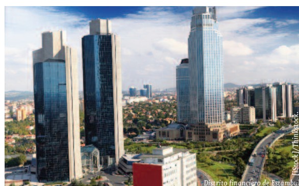
Distrito financiero de Estambul.

En el plano internacional, la inestabilidad en Oriente Medio ha interferido en los esfuerzos de Tur-