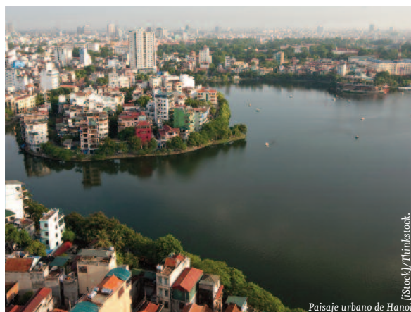
Paisaje urbano de Hanoi.

El apoyo al PCV por parte de la sociedad vietnamita se ha visto afectado por los crecientes problemas sociales derivados de la crisis económica global. Las protestas populares han aumentado en los últimos años y el Gobierno ha respondido con